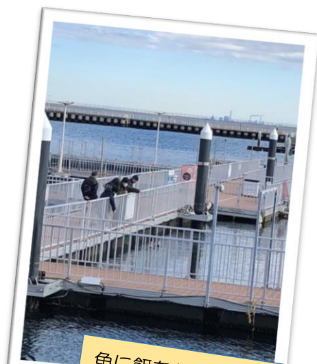
魚に餌をあげてます (鴨にえさを取られてます^^)

就職した後も交流をもてるので、好評です 次やりたい事は就職者の話し合っ て決まります。 次はどこに行こうか？