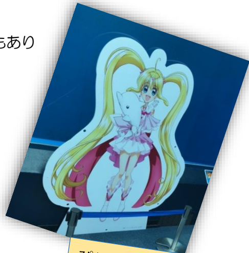
ぴちぴちピッチの コラボ